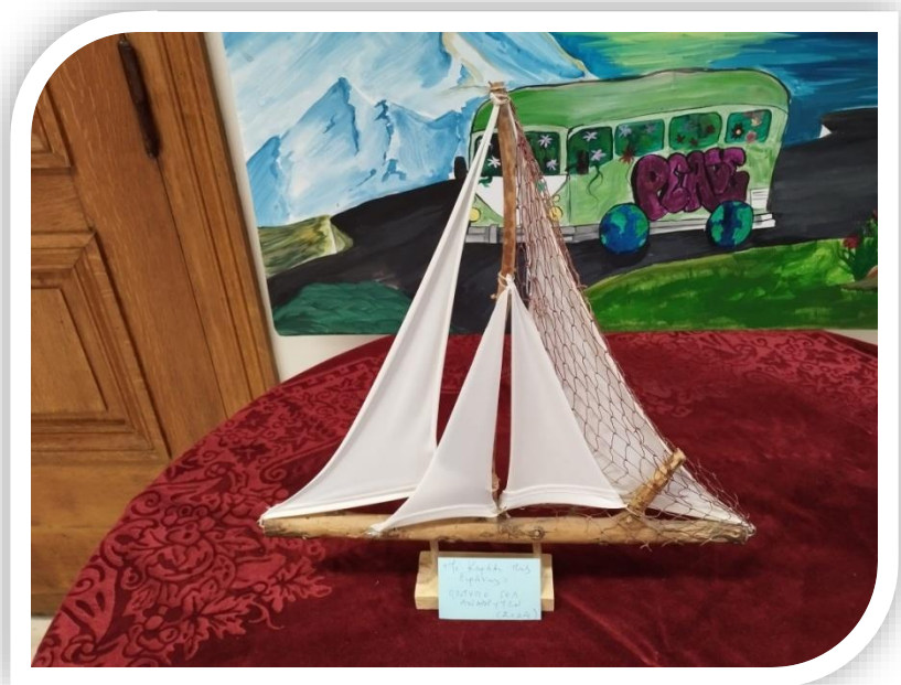
(Φωτό 2) «Το καράβι της ειρήνης» (Τέχνημα) Θερμές ευχαριστίες στον Όμιλο «Βουλής των Εφήβων» (2023-2024) για την ευγενική παραχώρηση του τεχνήματος