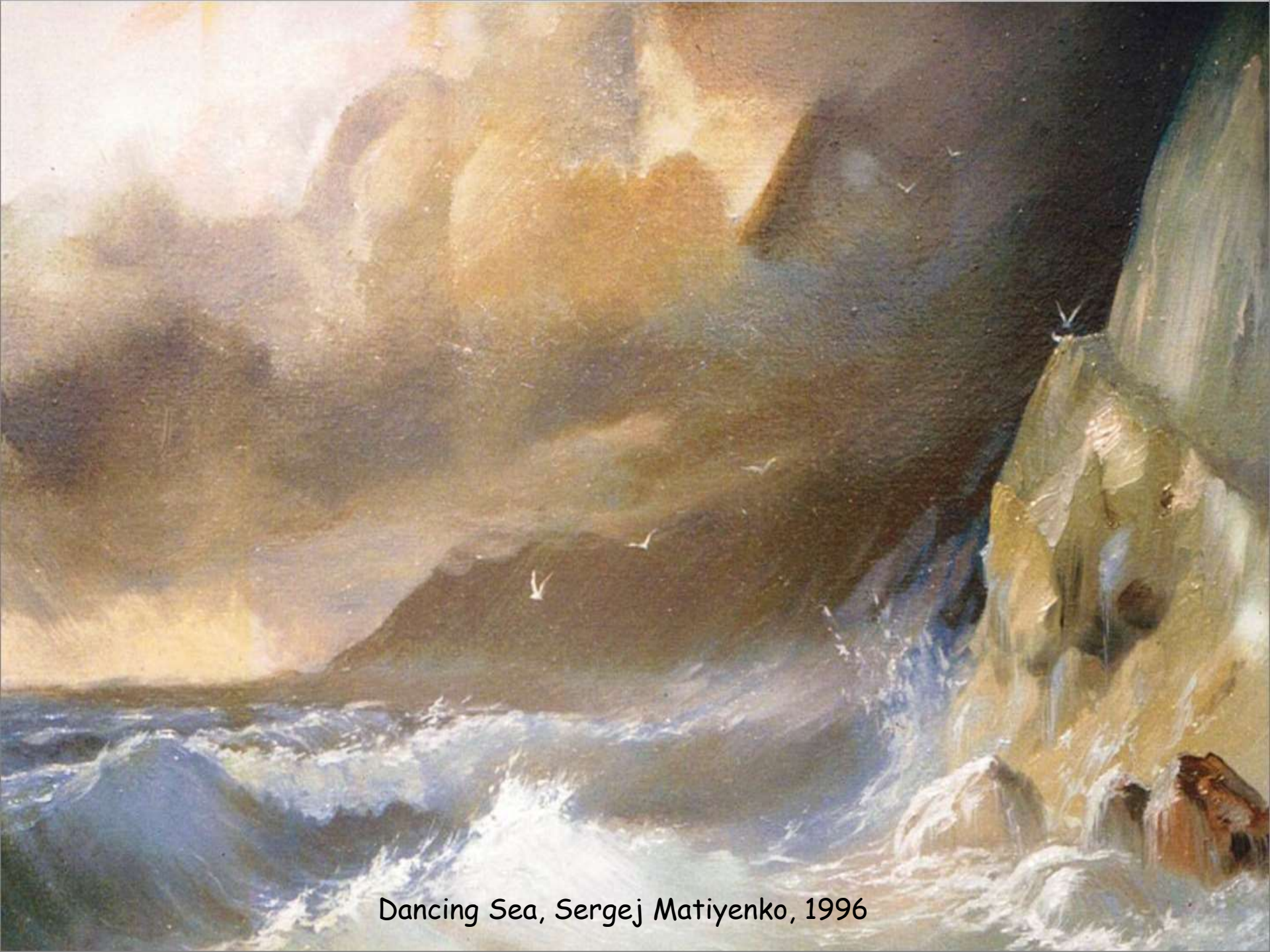
Dancing Sea, Sergej Matiyenko, 1996