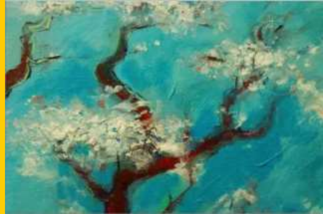
Vincent van Gogh

επιδιώκοντας την απόδοση, της ψυχικής εντύπωσης της θέας ενός αντικειμένου που βρίσκεται στη φύση