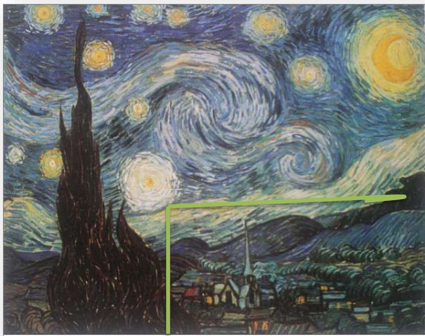
Έναστρη Νύχτα, 1889, Βαν Γκογκ

Χρώμα, φόρμες σαν να έχουν ψυχή μέσα τους (ανιμισμός)