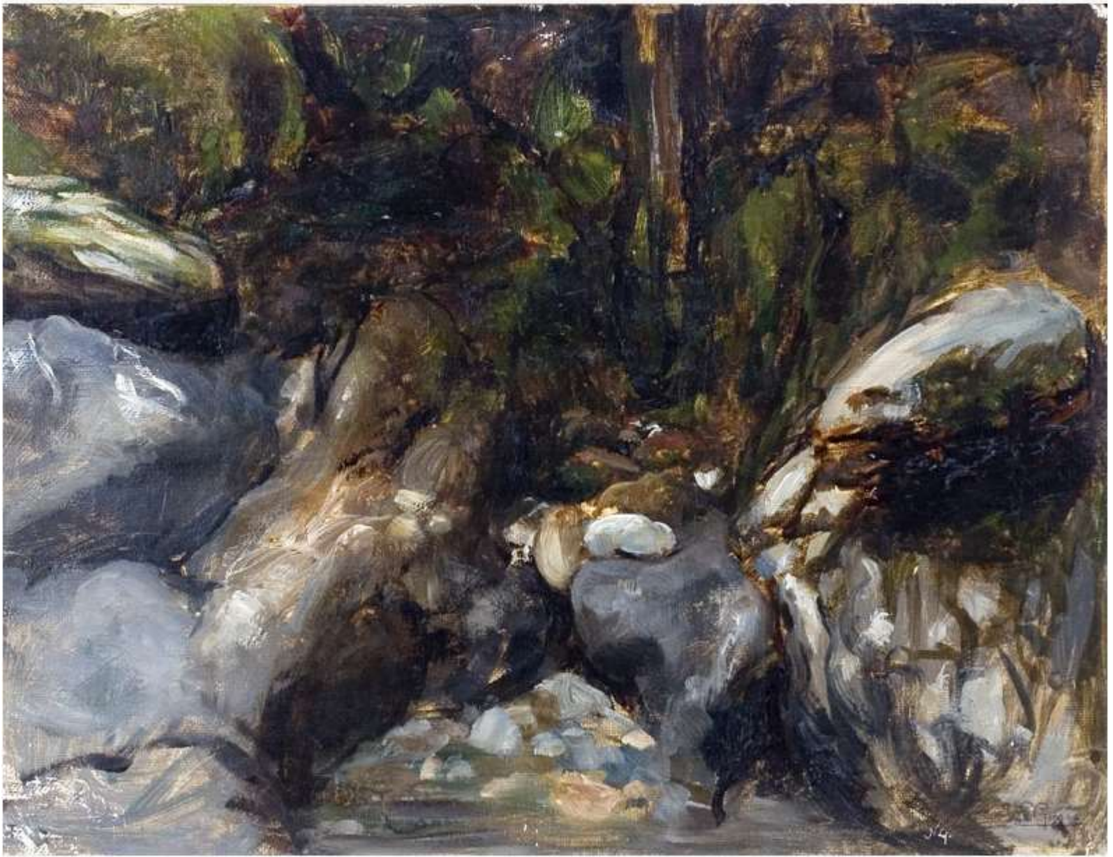
Ρυάκι με βράχια | ελαιογραφία - 1885 - 26X34 | Νικόλαος Γύζης (Σχολή του Μονάχου)