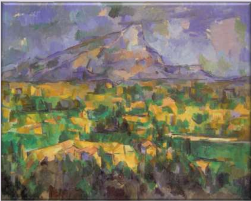
Το βουνό Sainte-Victoire, Σεζάν 1886-88