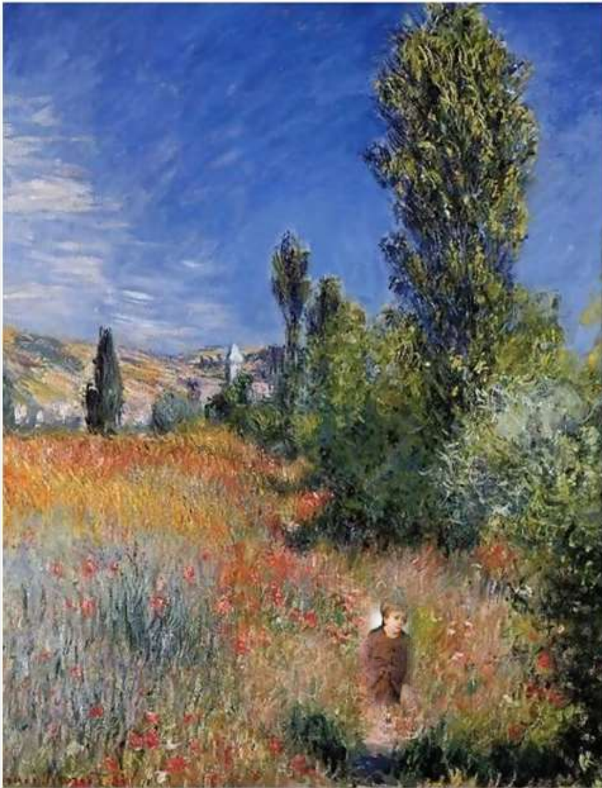
Landscape On The Ile Saint Martin Claude Monet