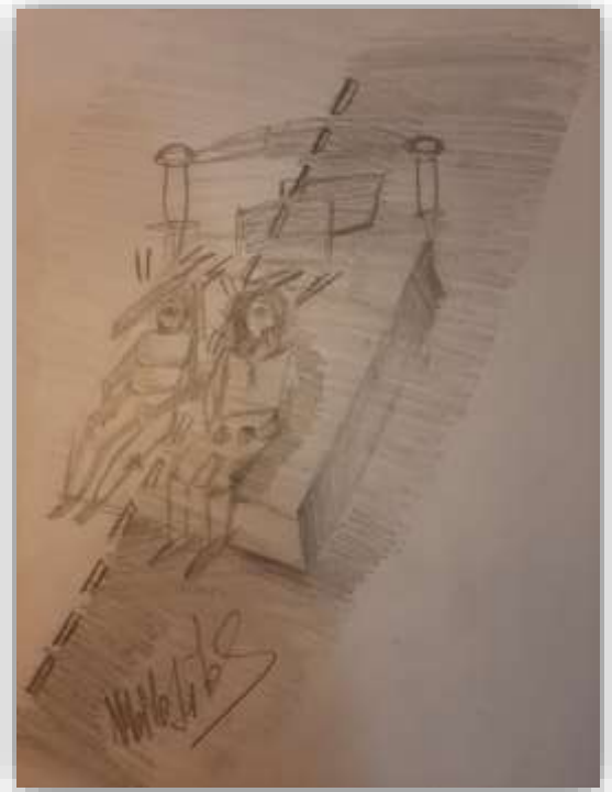
Εικαστικό: Εμμανουήλ Μιχαηλίδης (Α4)