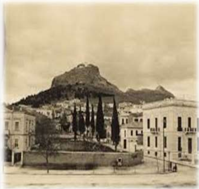
Οδός Πλατείας Συντάγματος