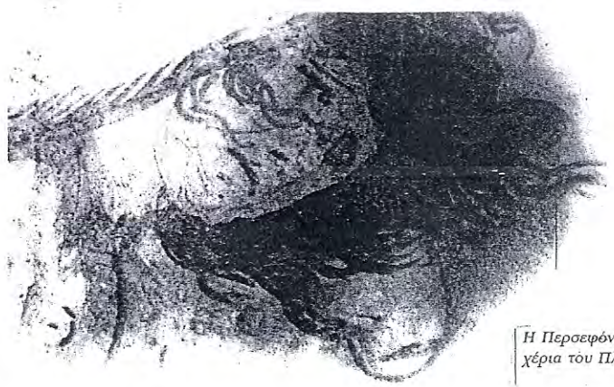
Η Περσεφόνη στα χέρια του Πλούτωνα

Ο μακρύς βόρειος τοίχος καλύπτεται από μια ολόκληρη σύνθεση που σώθηκε σε πολύ καλή κατάσταση, σε έκταση σχεδόν 3,5x1 μ. Στην αριστερή πλευρά εμφανίζεται ο Ερμής, που κρατώντας το κηρύκειο στο δεξί χέρι τρέχει ή πετά προς τα αριστερά, όπως δείχνει ο διασκελισμός του. Ο θεός φορά πέδιλα, κλαμύδα και κοπέλο στο κεφάλι. Με το αριστερό χέρι κρατά τα χαλινάρια των αλόγων του άρματος που φαίνεται πιο πίσω. Οι μορφές των λευκών αλόγων καταλαμβάνουν το κεντρικό τμήμα της σύνθεσης. Ακολουθεί ο δίφρος: οι ρόδες σώζονται σε πολύ καλή κατάσταση . Πάνω στο άρμα ο Πλούτωνας, που κρατά τα ντιά και με το ίδιο (δεξί) χέρι και το σκήπτρο του. Μακριά κοκκινοκάστανα μαλλιά και γένια πλαισιώνουν το πρόσωπό του. Ο Πλούτωνας έχει αρπάξει την Περσεφόνη, την οποία κρατά με το αριστερό του χέρι, ενώ μόλις έχει πατήσει με το ένα πόδι στο δίφρο. Η Περσεφόνη με τα δύο χέρια υψωμένα