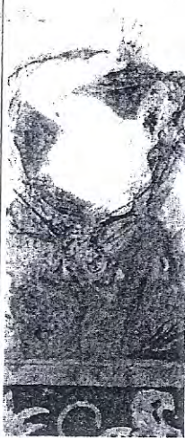
Η φίλη της Περσεφόνης ξαφνιασμένη

Η τοιχογραφία δεν είναι ενυπόγραφη. Ωστόσο οι αρχαίες μαρτυρίες κάνουν μια αναφορά που ενδεχομένως να σχετίζεται με το έργο αυτό. Ο Πλίνιος μιλά για το ζωγάφο Νικόμαχο του 4ου αιώνα π.Χ., που είχε ζωγραφίσει την Αρπαγή της Περσεφόνης.