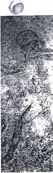
Ερμής κρατά τα χαλινάρια των αλόγων.