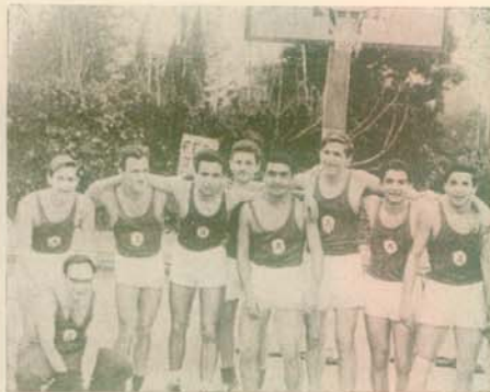
Ἡ ὁμάς Μπάσκετ, Πρωταθλήτρια Α΄ περιφερειακῆς (1958)