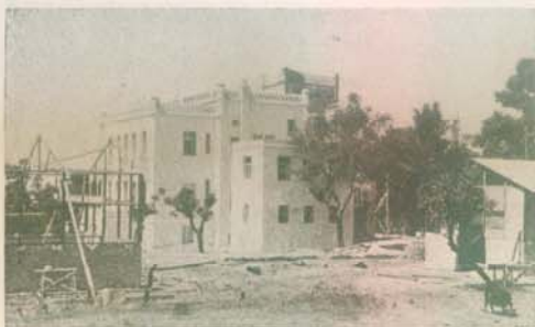
Ο άρχοντικός «Πύργος» του Α. Σαγγαρού πρώτο Διδακτήριο και Οικοτροφείο μαζί

Παράπλευρες κτίζονται οι πρώτες αίθουσες διδασκαλίας— Τά σημερινά...παραπήγματα (1949)