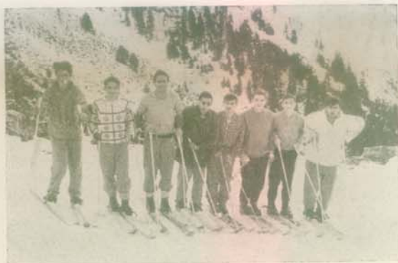
Σκι - Στόν χιονισμένο Όλυμπο (1961)