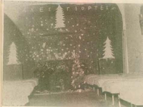
Θάλαμος «σαμπανι». Βραβεῖον Χριστογεννηιάτικης διακοσμῆσεως (1959)

...Κι ἦτανε τὸ πέρασμά τους σάν τὸ πέρασμα τοῦ νοῦ, ποὺ σὲ τίποτα δὲν στέκει καὶ περνάει ἀπὸ παντοῦ.