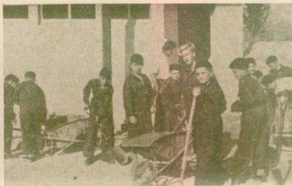
Ἡ πρώτη ἡμέρα τῆς «πρακτικῆς» (1949)