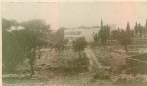
1951. Ο «Πύργος» και τὸ «Λευκόν» ἁδελφω- μένα στό καταπράσινο...ἄκτιστο τοπίο