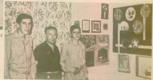
Ἐκθεσις Ζωγραφικῆς καὶ Σχεδίων στὸ σαλόνι τοῦ «Υμηττοῦ» (1962)