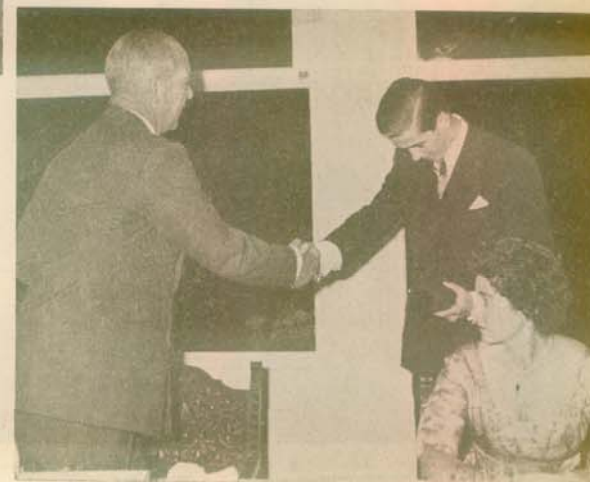
Ἡ τελευταία στιγμή τῆς Ἀ- ναβρουτινῆς ζωῆς του Ἀπὸ τόν καλὸ πατέρα πάλι παραλαμβάνει τὸ Πτυχίον - Ἐξέτισιον

Ἔτσι ἦταν τὸ ἔθνομά του στά ἐννέα μαθητικά χρόνια, πὸν τὰ ἐπέρασε ἀποκλειστικά (ἐσωτερικός) στ' Ἀνάβρου- τα ὁ πράγματι ἐψηλότατος στό ἀνάστημα καὶ ἰποδειγμα- τικός στό ἦθος μαθητῆς βασιλεὺς Κωνσταντῖνος.