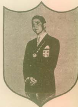
Ὁ Ὀλυμπιονίκης Βασιλεὺς (1960)