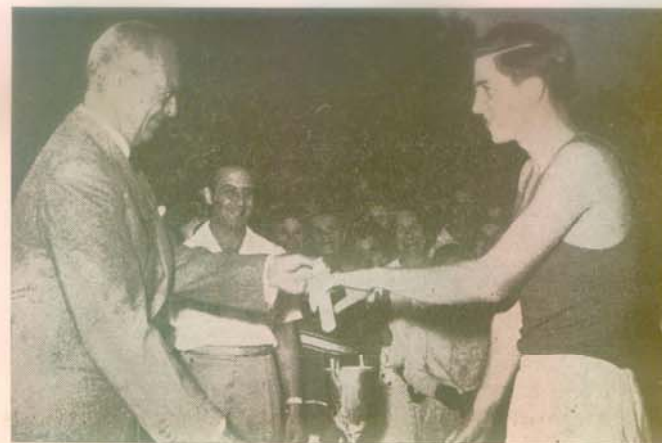
Ο Βασιλεὺς βραβεύει τόν Ἰών - ἄθλητή μέ ἀνεπιτήδευτη πατριική ἱκανοποίηση