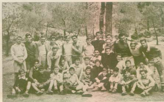
Στήν ἀγκάλη τῆς Φύσεως — Έκδρομή (1958)