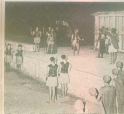
Ἀπὸ τὴν παράστασι τῆς τραγωδίας «Αἴας» τοῦ Σοφοκλέους (1967)