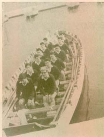
Ναυτική ἐκπαίδευσις — Στόν Σκαρμαγκᾶ (1961)