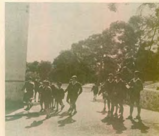
Πρὸς τὸ Λιδακτήριον (7.45')

«Κι ἡ ψυχὴ σου, ὦ πολιτεία, θὰ κατασταλάξῃ πέρα ...στοῦ ἡλίου τῆ χαρά...»