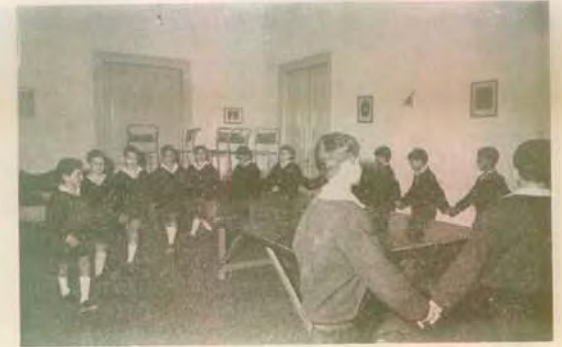
*Ελληνικός χορός (μάθημα στον «Πύργο», κάθε Τετάρτη)