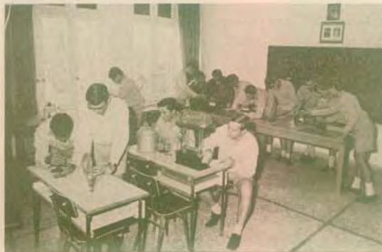
Στό εργαστήριο Φυσικής