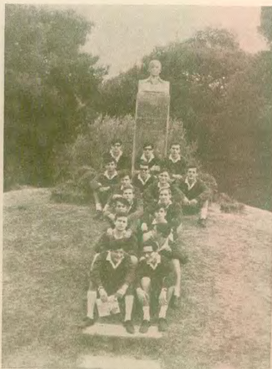
Οί Τελειόφοιτοι (μὲ τὸ χαμόγελο στὰ χεῖλη, ἔτοιμοι γιὰ τὸ στίβο τῆς ζωῆς)