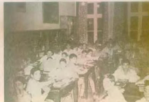
Τὸ κοινὸν Ἀντιφωστήριον - Βιβλιοθήκη στὸ «Λευκόν», ὅπου μελετοῦν 105 μαθηταὶ