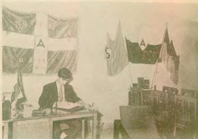
Ὁ «Φύλαξ» τῶν παραδόσεων καὶ τῆς τιμῆς τοῦ Ἐκπαιδευ- τηρίου, ἀρχηγὸς τῆς μαθητι- κῆς Κοινότητος