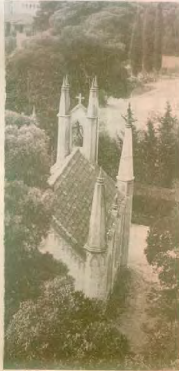
Ὁ «Ἅγιος Ἀνδρέας» (Ἰδιόκτητος ναῦκος τοῦ Ἀνδ. Συγγροῦ, 1880)