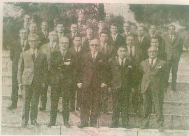
Οί Καθηγηταί μας πρόθυμοι ὁδηγοὶ καὶ συνεργάται