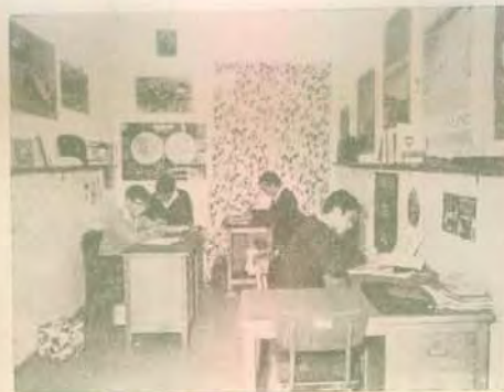
Ἰδιαίτερα μελετητήρια τῶν μεγάλων μαθητῶν στὰ Κτήρια

Ὁ Δ. Σβολόπουλος στὸ Ἰσραήλ πρῶτος στὰ 110 μ. μετ' ἔμποδιον (1969)