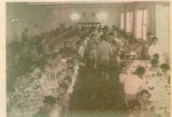
Γεύμα στην ευλόγηση τραπεζαρία