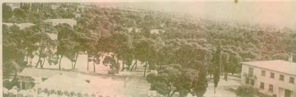
Ἡ Ἀναβοντινὴ... πολιτεία ἀδελφωμένη μετὰ τῆ μαγεία τῆς φύσεως