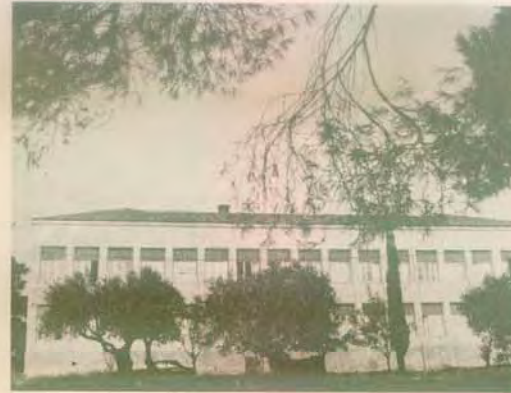
Τὸ «Λευκόν»—Διδακτήριον Γυμνασίου καὶ Δημοτικοῦ (ἀνέγερσις 1950)