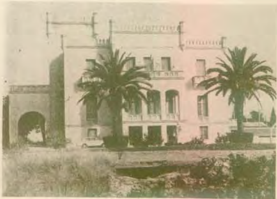
Ὁ «Πύργος» τοῦ Ἀνδρ. Συγγροῦ—Οἰκοτροφεῖον τοῦ Δημοτικοῦ (Ριζική ἀνακαίνισις 1949)