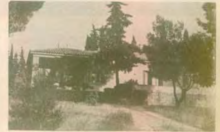
Γραφεῖα Γεν. Διευθυντοῦ, Οἰκονομικῶν Ὑπηρεσιῶν καὶ Γραμματείας (ἀνέγερσις 1951) (Ἐξρησιμοποιήθη μέχρι τὸ 1958 ὡς οἰκία Γεν. Δ/ντοῦ)