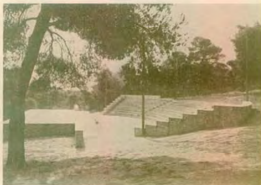
Ἵπαιθριον θέατρον 650 θέσεων (ἀνέγερσις 1956)