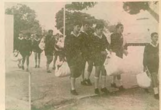
Αδοξοληρέτης (παραλαβή σάκκων από τὸ πλυντήριο)