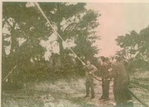
Ἡ προσβ/γή ἄμὰς ἐν... δράσει