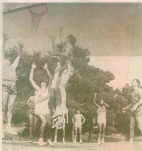
Μπάσκετ Μπώλλ, ένα απ' τὰ πύ ἀγαπητὰ παιχνίδια