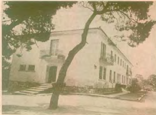
Ὁ «Υμητιὸς»—Οἰκοτροφεῖον Γυμνασίου (ἀνέγερσις 1954)