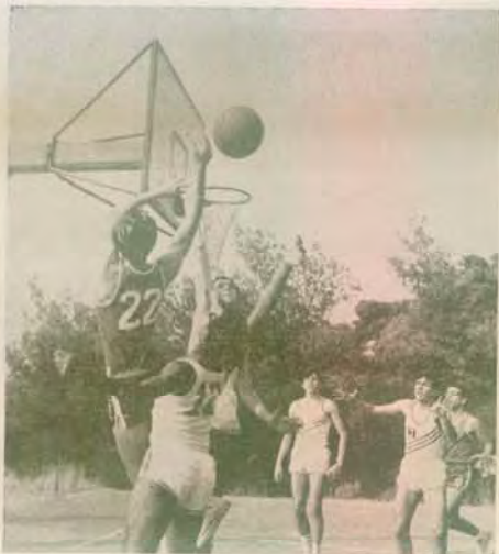
«Υμητός» και «Ανατολικόν» οι καθιερωμένοι αντίπαλοι