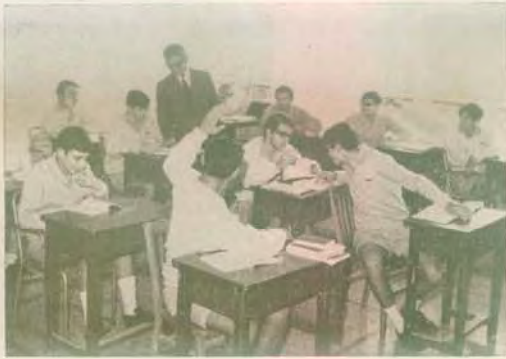
Λύσεις ασκήσεως στην Κοσμογραφία