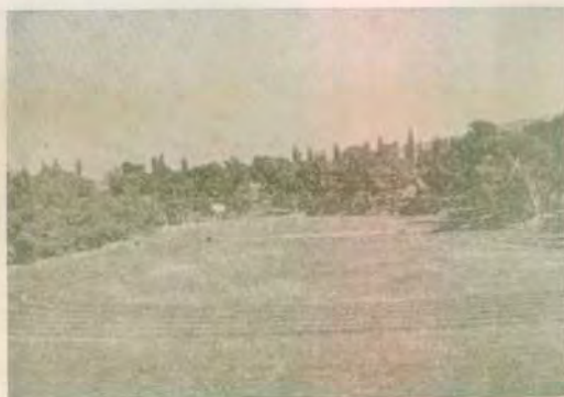
Στάδιον Ε.Ε.Α. (κατασκευή 1953)