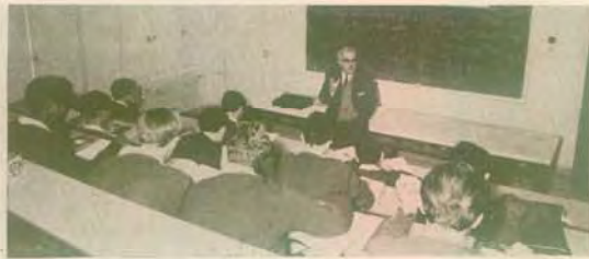
Σπονή άρχαίων συγγραφέων